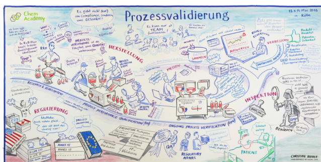
Graphic Recording der Fachtagung Prozessvalidierung 2019