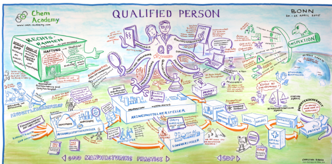
Graphic Recording der Fachtagung Qualified Person 2015

In Ihrem Unternehmen gibt es mehrere Interessenten für unsere Veranstaltung? Melden Sie gleichzeitig zwei oder mehr Personen für mindestens zwei Tage an und sparen Sie jeweils 300€ ab dem zweiten Teilnehmer.