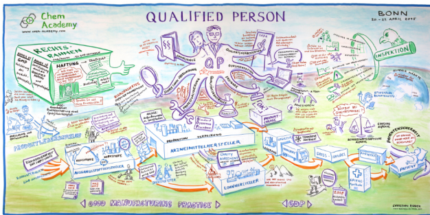
Graphic Recording der Fachtagung Qualified Person 2015