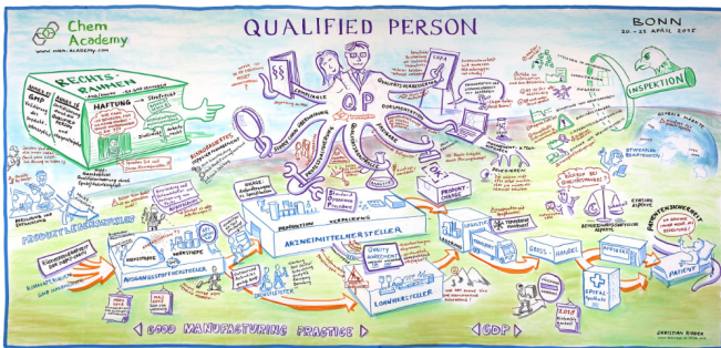
Graphic Recording der Fachtagung Qualified Person 2015